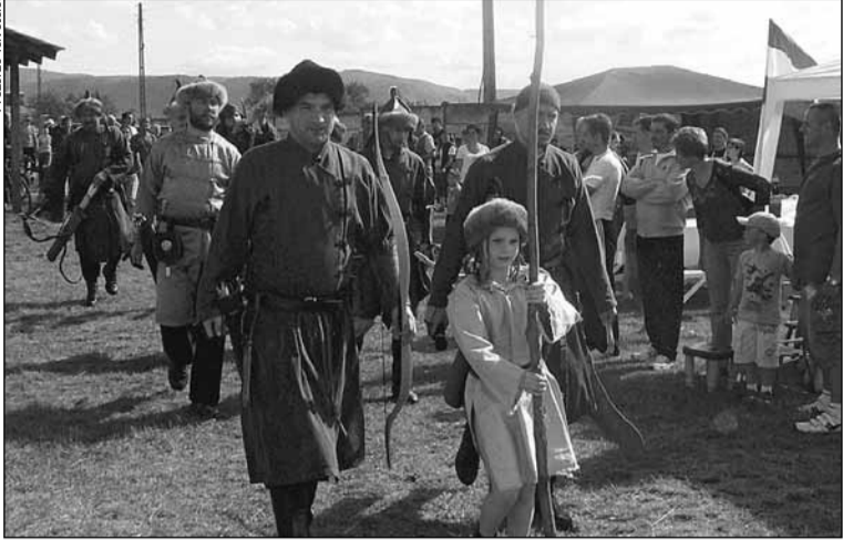
A nagyváradi íjászcsoport ünnepélyes bevonulása

Az élesdi magyarság idén is megszervezte a hagyományos Élesdi Ifjúsági Napokat. Egy héten át különböző rendezvények zajlottak, a záróesemény szombaton volt a helyi sportpályán.