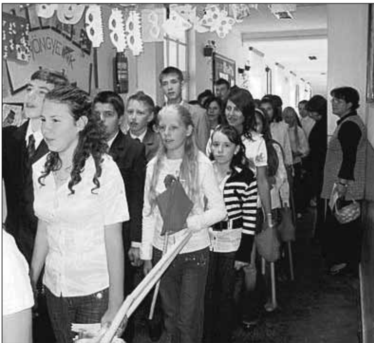
Két végzős nyolcadik osztály ballagott Szalacson