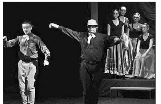
Szeretettel vár mindenkit a táncegyüttes!

Évadjának utolsó előadásait kiszállások sorában ejti meg Bihar megye hívatásos magyar néptáncegyüttese. A Kínai Világkiállításra készülődő társulat június 9-én Aradon, majd június 13-án, vasárnap 19 órától a Belényesi Művelődési Házban játsza Tragédia című táncjátékát. A Fekete Körös-völgyi magyarságnak szeretne kedvezni e módon a Nagyvárad Táncegyüttes. Az ember tragédiája c. Madách-dráma nyomán készült előadás magyar, román és cigánytáncokat felsorakoztató néptáncműsor, mely a kényszerű emberi sorskérdésekkel foglalkozik, a nő (Éva) és a férfi (Ádám) közötti küzdelmet, harmóniát és diszharmóniát, illetve a rossz (Lucifer) és jó (Ádám és Éva) közötti állandó küzdelmet ábrázolja. Jegyeket elővételben a belényesi RMDSZ-székházban lehet vásárolni: felnőtteknek 10 lej, diákoknak és nyugdíjasoknak 5 lej.