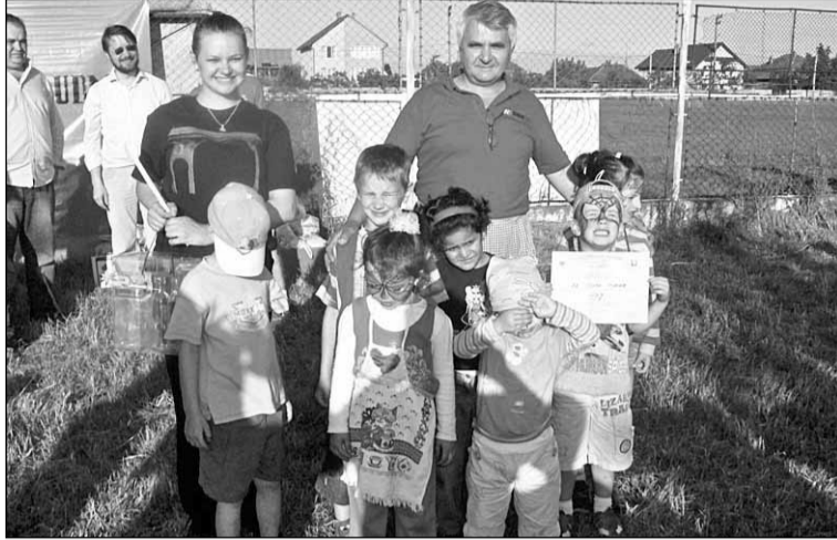
A főzőverseny idei győztese a Ovisok Csapata lett